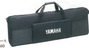
V2用ソフトケース SC-V ¥5,500

● 先進のMIDI機能。 受信プログラムチェンジ番号と音色番号を自由に対応させるアサインテーブルを作成可能。V2の音色を変えることなく、送信先の音色だけを切り換えられるセンド・プログラムチェンジも装備。さらに、プレイモードでデータエントリースライダーを操作して、コントロールチェンジデータを出力できるのも、ハイテクな機能です(コントロール番号1~31)。